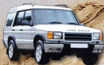
Land Rover Discovery 2.5